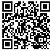
QR code chanson associée à l'activité